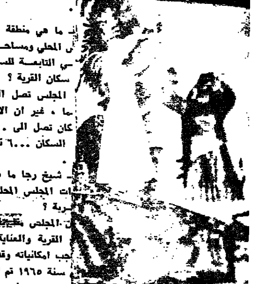
ياسمين... عضو المجلس المحلي... في انتخابات... التي أجريت... في ١٩٧٦...